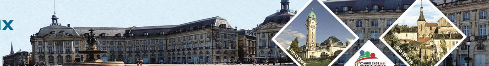
Table ronde IST 18 juin 2021

16 - 18 JUIN Bordeaux 2021 PARC DES EXPOSITIONS